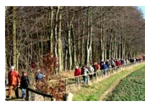
Rund 100 Gäste nutzten sogleich den neuen Pfad

Hier geht's zum Stiftungsatlas → ...mehr