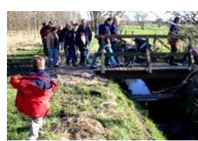
Raus aus dem Wald über die neue Brücke